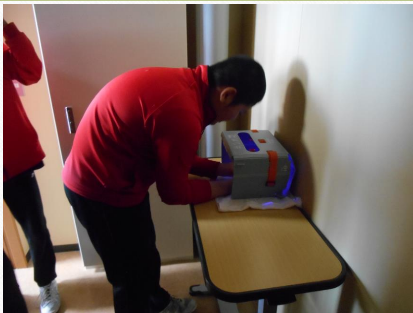
手洗いチェッカーで自分の手の汚れを確認。