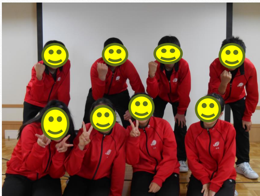
砂川中学校生集合写真