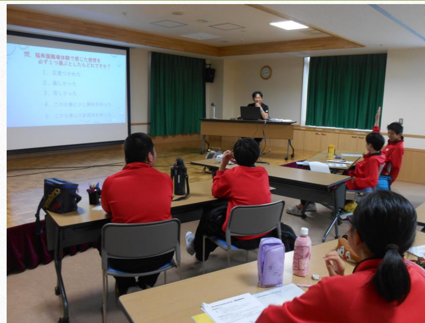
座学で介護職場の理解を深める。