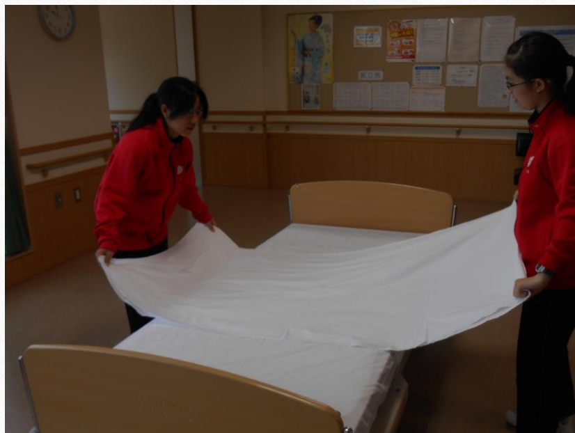
ベッドメイキングを体験。