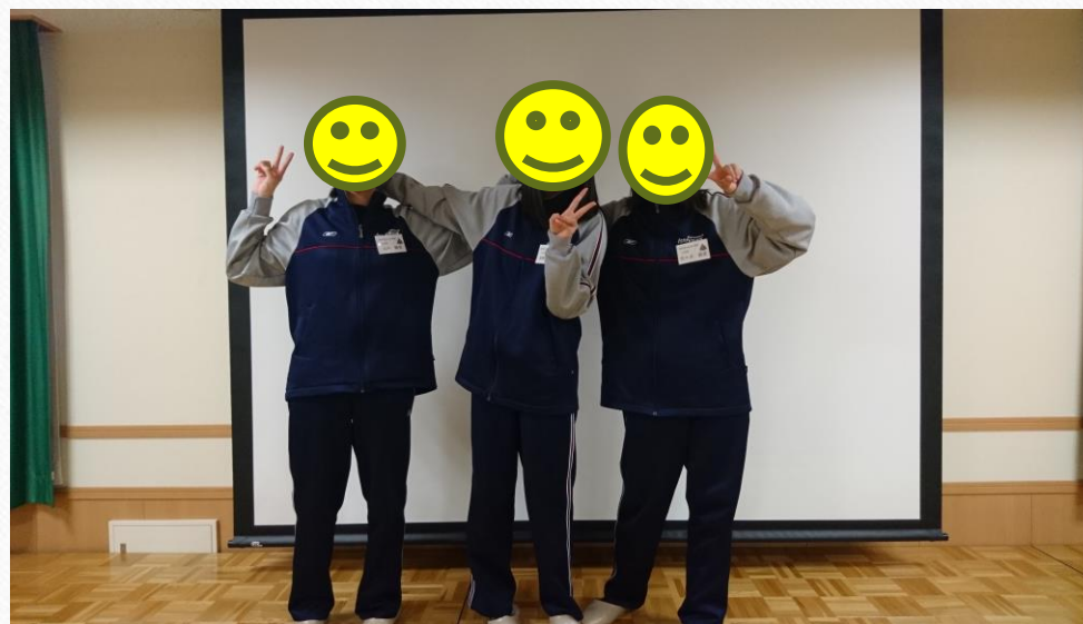
石山中学校生集合写真