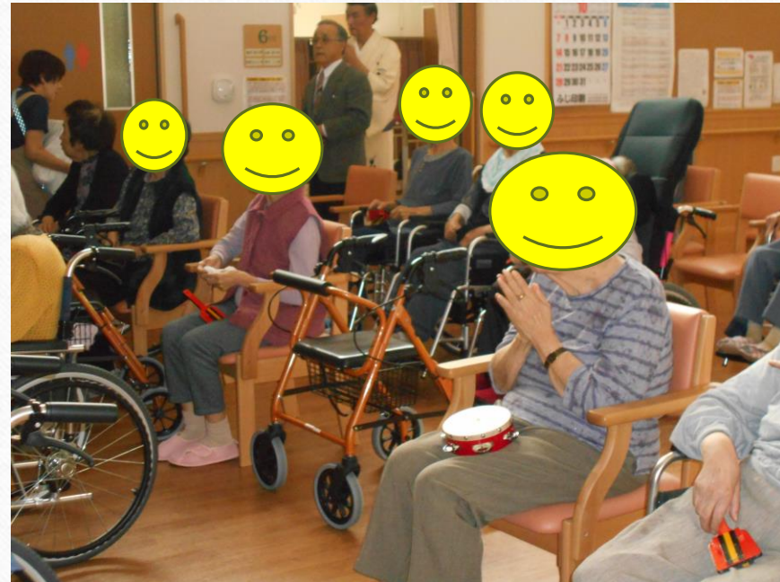
カラオケボランティア：萩の会