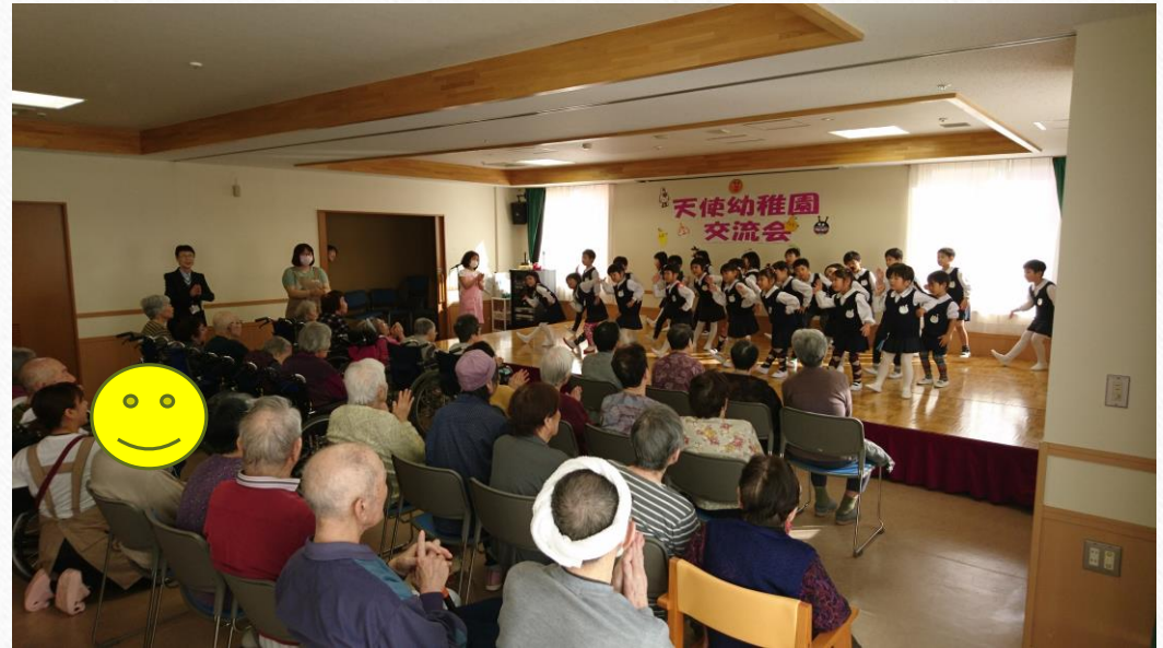
天使幼稚園児のお遊戯を観賞