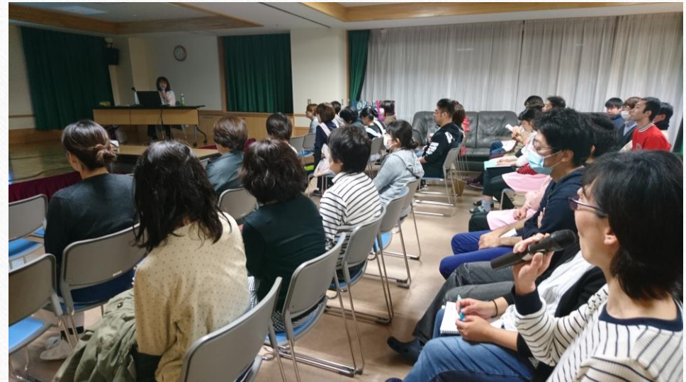
事前に準備していた、認知症困難事例に対して質問をする。